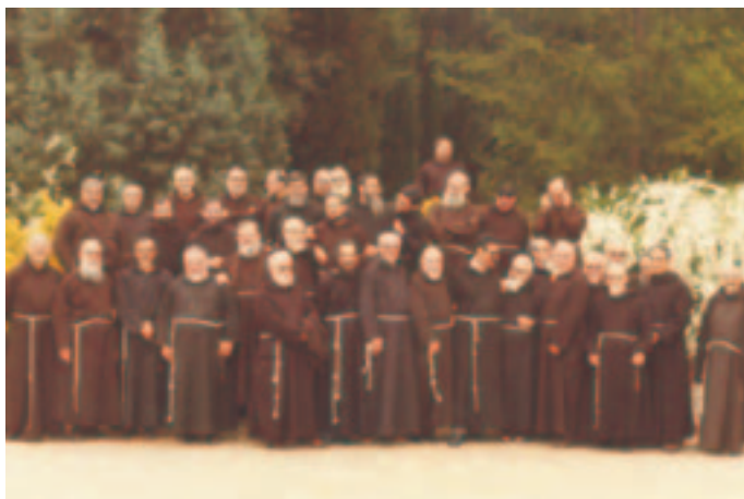
Convegno dei Superiori Maggiori Cappuccini italiani (Foggia 1981)