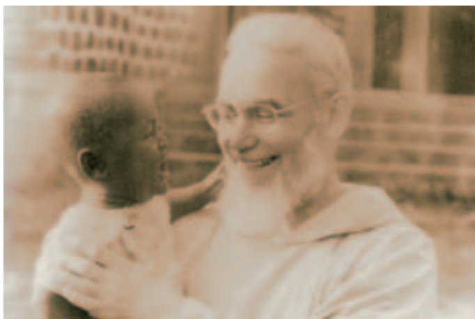
P. Francesco durante uno dei suoi viaggi in Africa (1982)