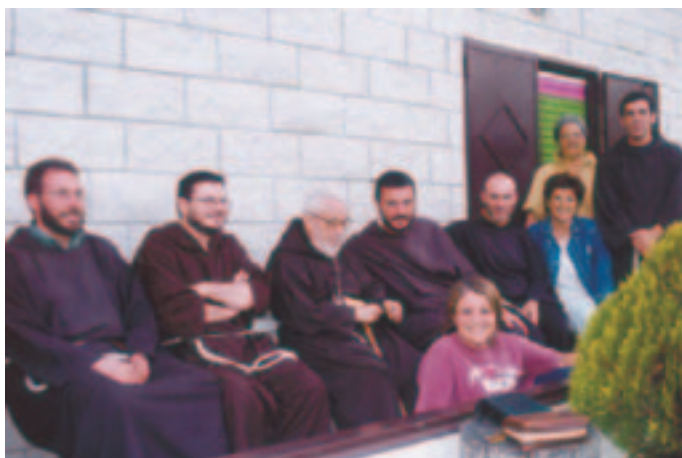
P. Francesco a Montevergine per una giornata di relax con frati e volontari