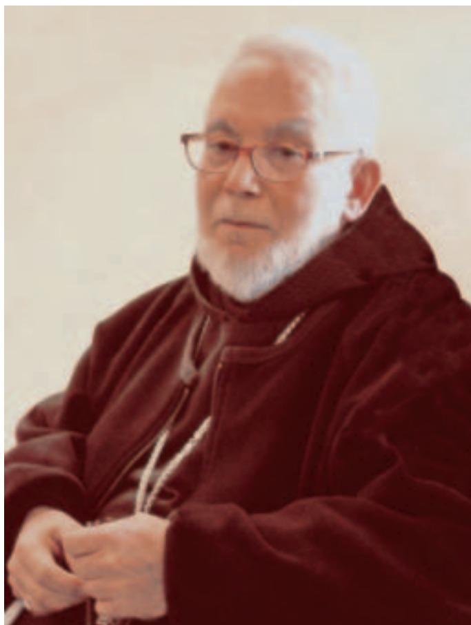
Una delle ultime foto di P. Francesco nell'infermeria dei Cappuccini di Nola.

la gratitudine su una persona, vuol dire che la sua vita è stata lunga, e quindi inconsciamente ci si avvia verso il tramonto.