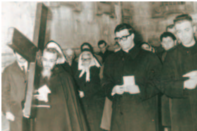
A Gerusalemme (1966) per la via Crucis verso il Calvario.