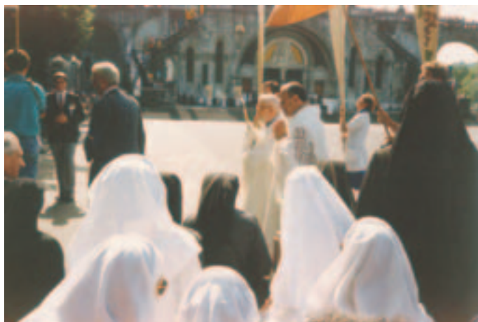
P. Francesco a Lourdes durante la processione eucaristica (28/7/1992)