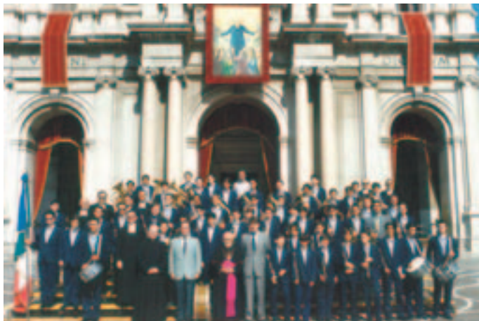
Festa del Beato Bartolo Longo, Fondatore del Santuario e della Nuova Pompei (5 ottobre 1994)