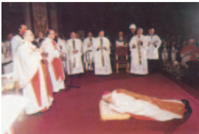
Consacrazione episcopale di P. Francesco. Prostrato sul pavimento, chiede aiuto alla Madre di Dio e ai Santi (Pompei, 7 dic. 1990)