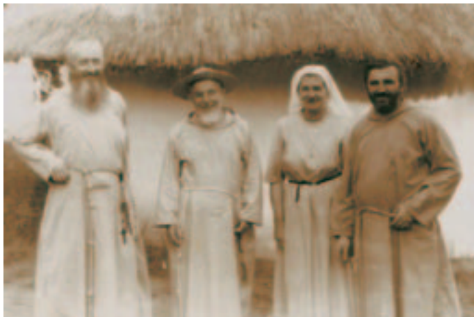
P. Francesco in Africa con missionari.