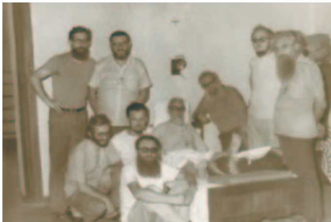
P. Francesco in Zaire (1982), predica un corso di esercizi spirituali dal letto a causa di una trombo-flebite.