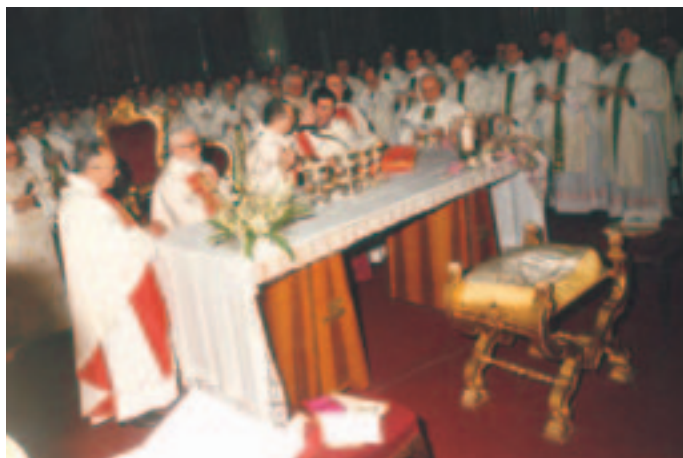
Consacrazione episcopale di P. Francesco. Un momento della concelebrazione (Pompei 7 dic. 1990).