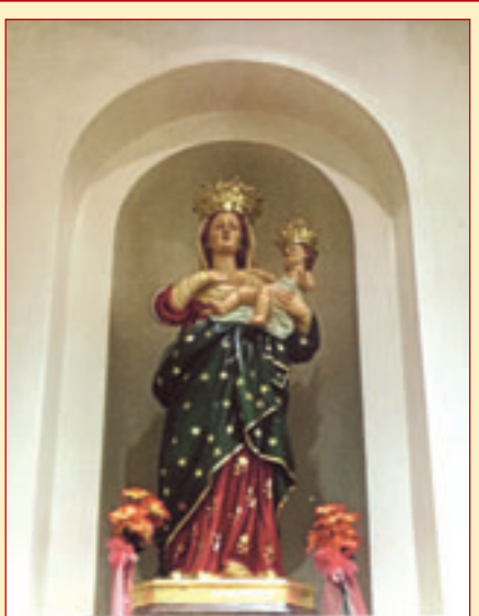
Statua della Madonna delle Grazie nella chiesa di Sant'Anna in Hamden (1938-2017)

La vostra lettera mi ha commosso, sia per la vostra sofferenza e sia perché non lontano da voi, Waterbury, è stata chiusa la chiesa di Santa Lucia dove era collocata la statua della Madonna delle Grazie. Nei secoli scorsi la fede dei nostri padri costruiva chiese e statue della Madonna e dei Santi, nonostante la povertà endemica del tempo; ora purtroppo nel giro di due-tre generazioni il mondo cristiano si trova in discesa libera, registrando un ridimensionamento spaventoso. Le chiese vengono chiuse per-