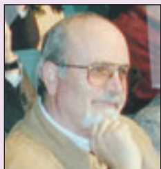
Piazza Ernesto Antonio di Castelvenere * 2/1/1948 + 11/7/2007