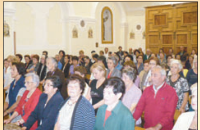
Fedeli al Santuario